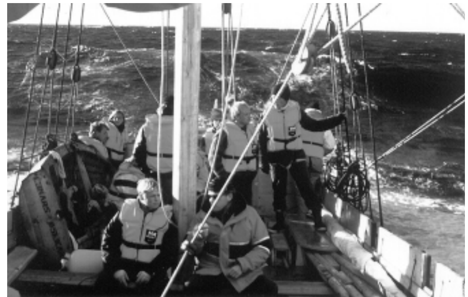
Blaaheias hjemtur fra Norge 1995, udeskærs omkring Sør-landet.