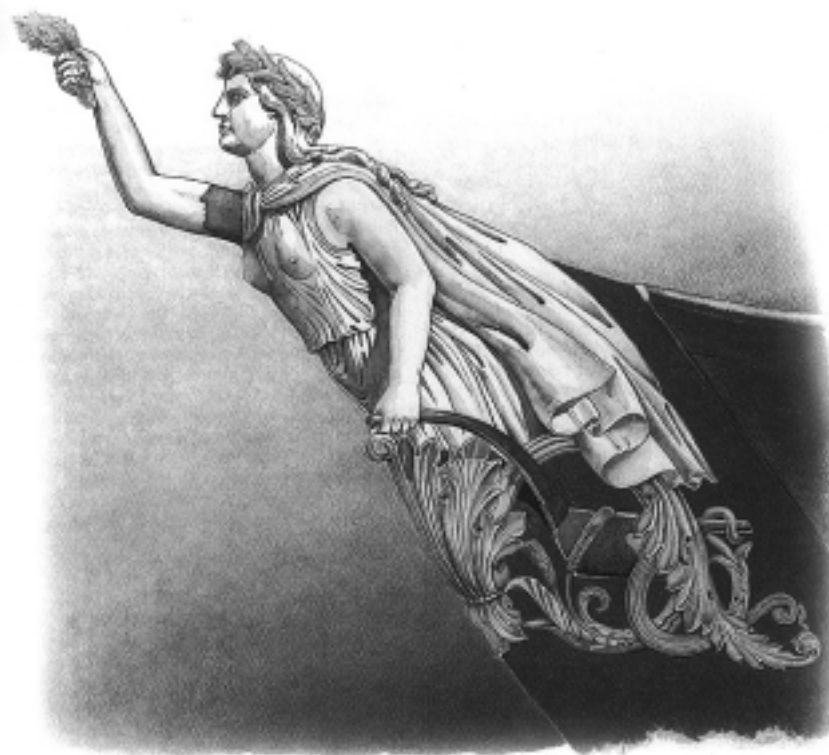
Illustration fra bogen "Flådens ansigt". Galionsfiguren fra skruefregatten Sjælland.

■ Jens Riise Kristensen: Flådens Ansigt, 111s., 248 kr. Forlaget Skib.