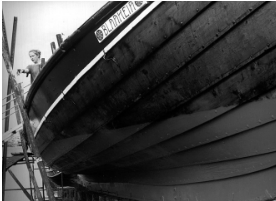
Fra Blaaheias klargøring 2000.