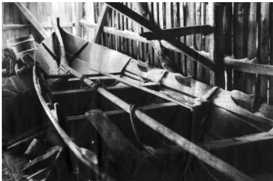
Geitbåden i naustet i Gresset.

løbet af slutningen af 1700-tallet blev det småt med fyrreskoven på Fosen. Granskoven som havde "indvandret" nogle hundrede år tidligere, var ved at tage over, men gran egnede sig ikke