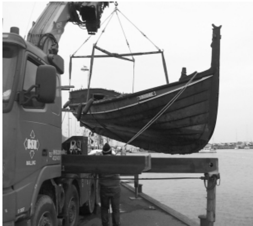
Blaaheia blev løftet på land d. 24/1 så reparationen af vaterbordet kunne påbegyndes.