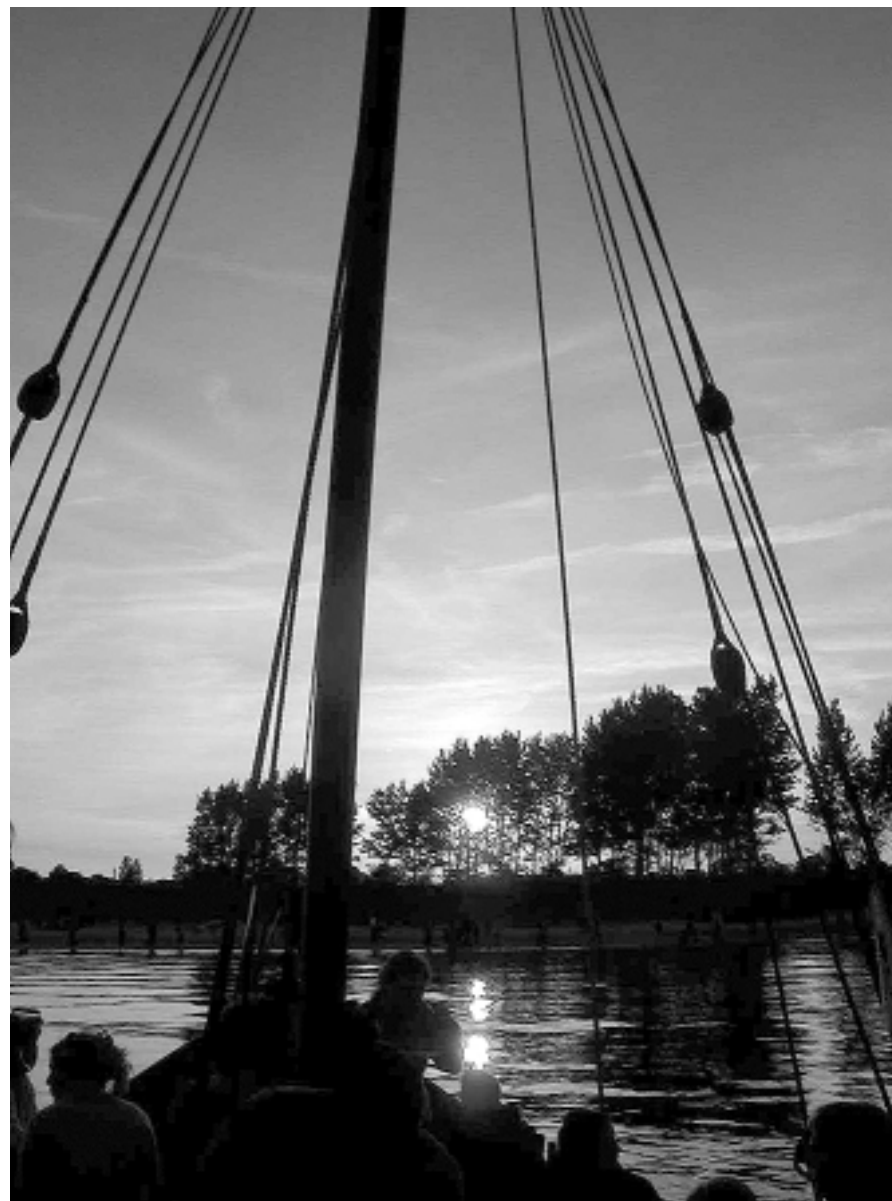
Skt. Hans aften 2002 på Århus-bugten.

Har du en mistanke om, at dine hjemmestrikkede sokker eller dine yndlingsunderbukser kunne ligge i en af tøjsækkene i rummet, må du selv tage initiativ til at afhente dem, ellers kan du jo byde på dem til auktionen den 8. marts.