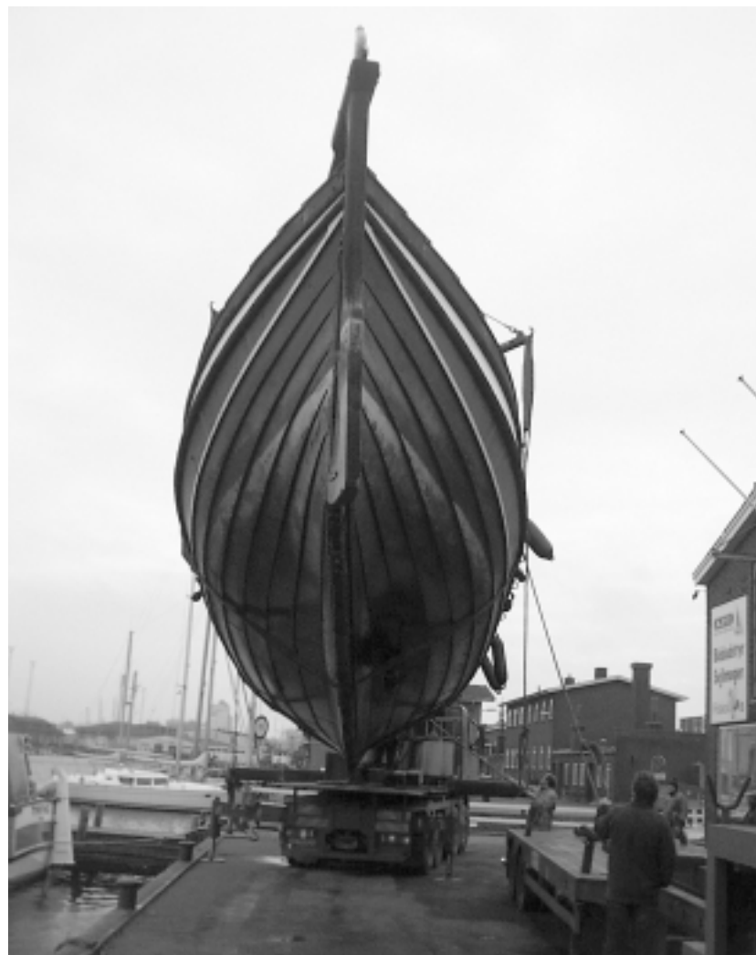
Optagning af Blaaheia d. 24/1.

Det blev besluttet, at sætte en fremtidsdag i værk lørdag d. 8. februar. Søblomstens klargøring aflyses ikke