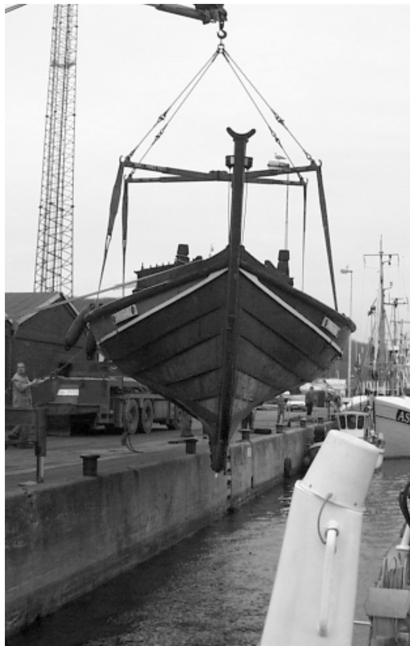
Op af vandet d. 24/1.