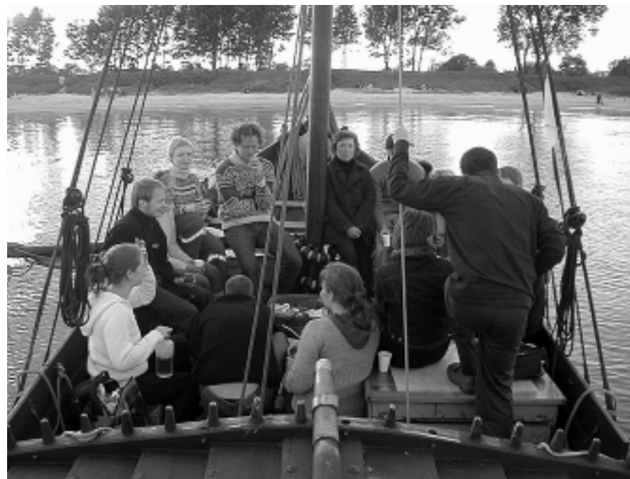
Skt. Hans aften på Århus-bugten.