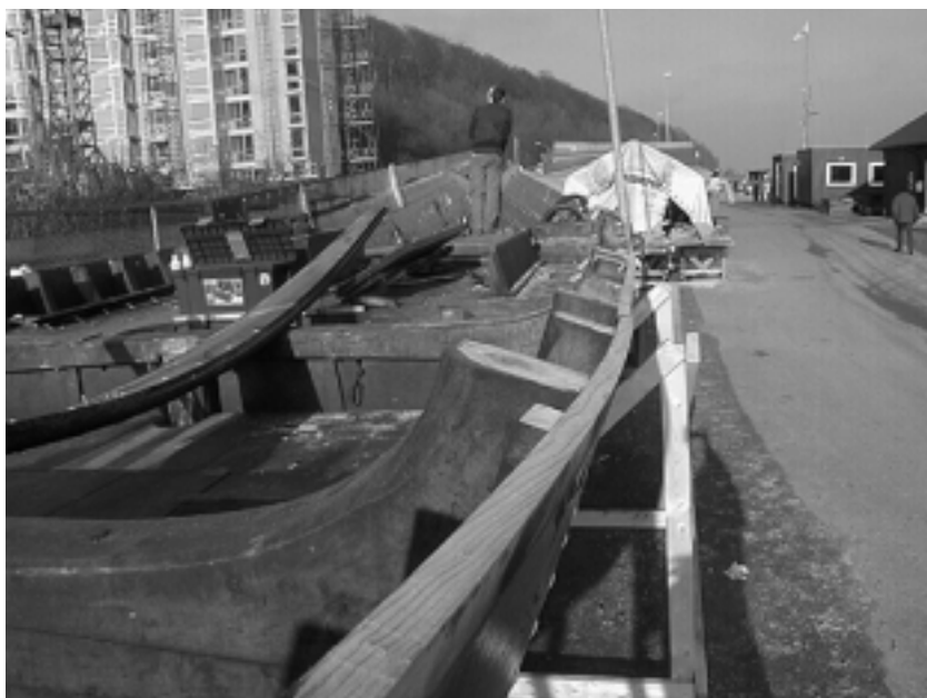
Blaahaia på land med afmonteret vaterbord, søndag d. 9/2.

Nedenfor en lille beretning fra starten på vaterbordsprojektet, nemlig den weekend vi fik Blaahaia på land og gjort klar til den forestående måneds arbejde.