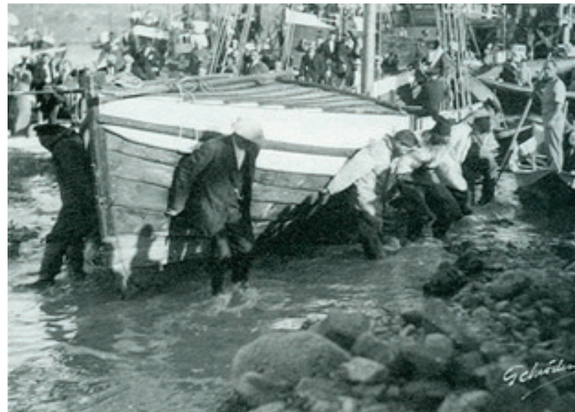
Søsætning af "Den Sidste Viking" 1935. Fra bogen "Nordlandsbåden og Åfjordsbåden".