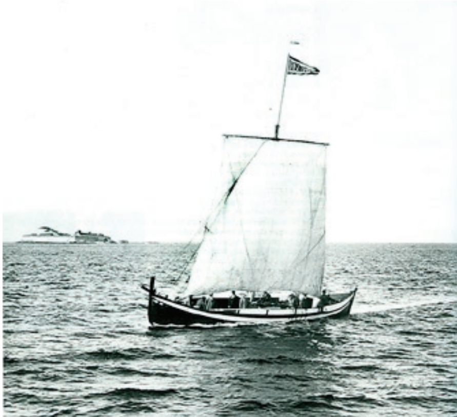
Storfembøringen "Den Sidste Viking" ved Munholmen i Trondheimsfjorden, 1930. Fotograf ukendt. Fra bogen "Nordlandsbåden og Åfjordsbåden"