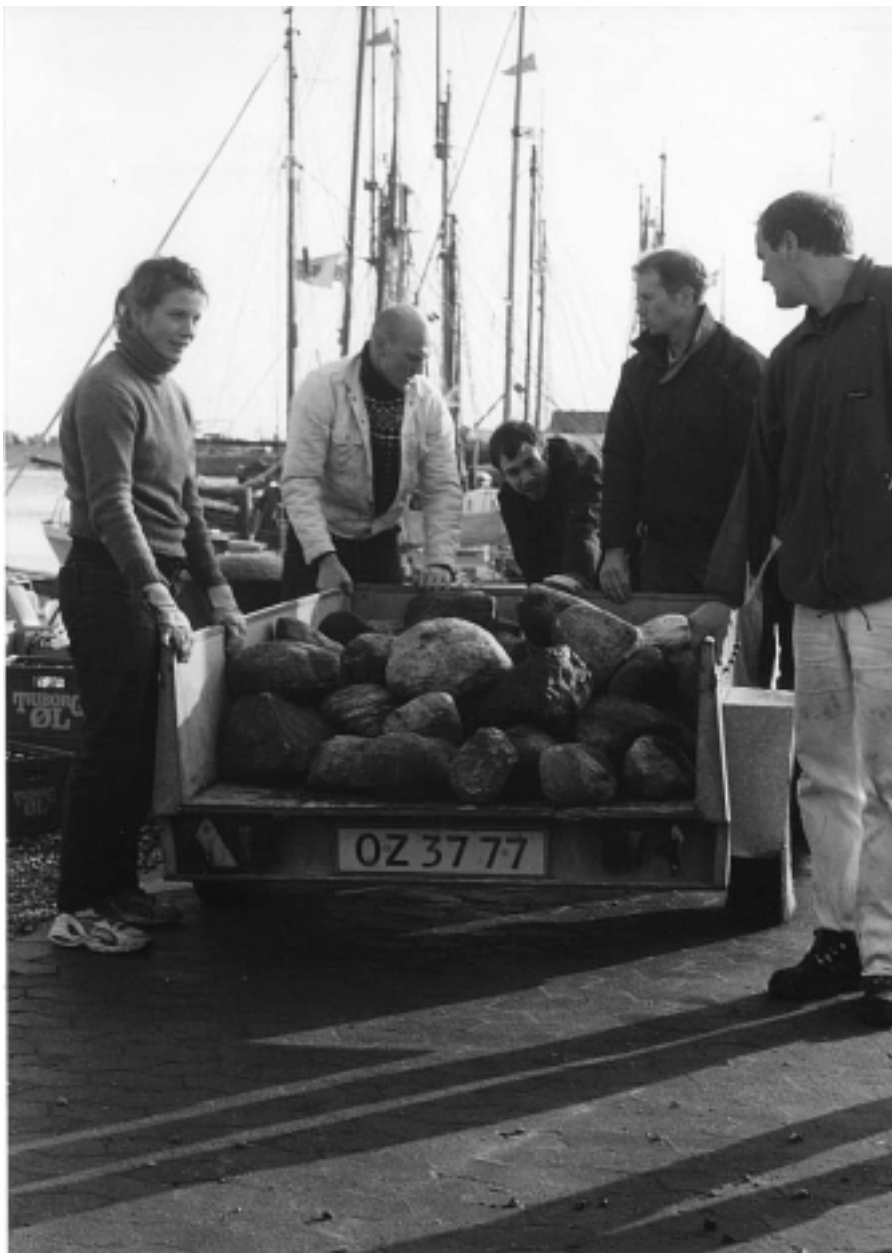
Vinterklargøring 2000