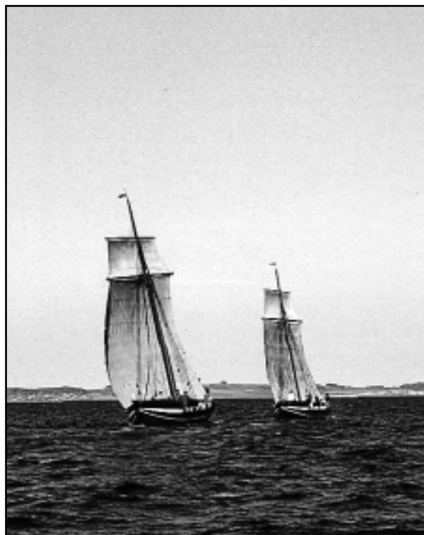
Søblomsten og Blaaheia, maj 2000.