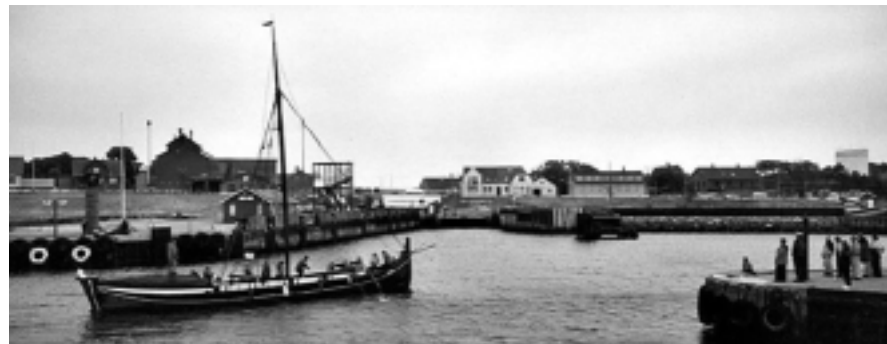
Blaaheia anløber Kolby Kås under Kartoffelkalas'en 2000