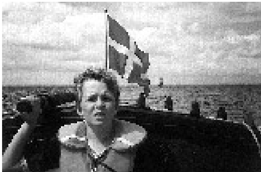
Familiaturen 2001.

k. Skipperne vil blive inviteret med til et skippermødearrangement. Indhold af dagen vil bla. være overdragelse af båden, planer for sejlads mm. Palle og Mette inviterer.