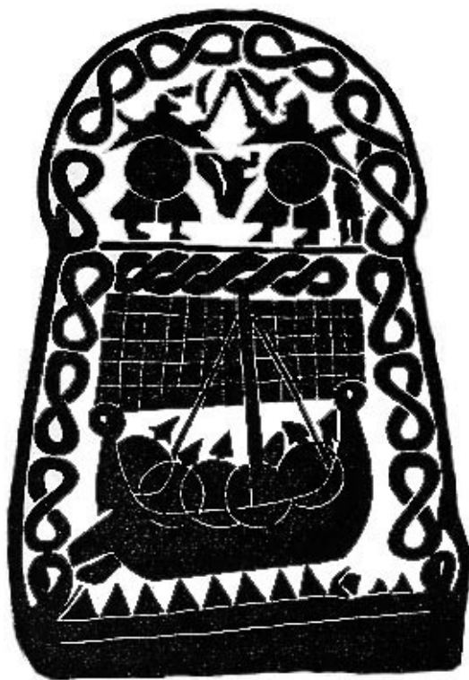
Billedsten fra När Smiss på Gotland (hvor Blaaheia formentlig kommer forbi på sommerens Østersøtoget)