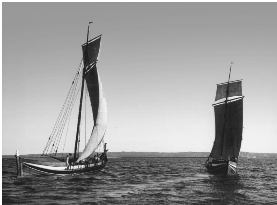
Et af de flotte fotos fra fototuren.

Dieter Skovbo Nørrebrogade 14 st. tv 8000 Århus C